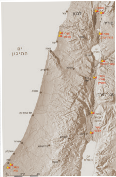
מפת הגשרים שפוצצו בליל הגשרים

ב-12 ביוני 1946 הכריז שר החוץ הבריטי, ארנסט בוויין, כי הממשלה הבריטית חוזרת בה מהתחייבותה לאפשר עליית 100,000 יהודים לארץ ישראל. בוויין טען שפתיחת שערי הארץ לפני יהודים אלו תכביד עליהם, כי תצריך משלוח של דיוויזיה בריטית נוספת והוצאה של 200 מיליון ליש"ט מאוצר המדינה. לפיכך החליטה תנועת המרי העברי שבמדינה והבריטים ימשיכו במדיניות 'הספר הלבן', הפוגעת בזכות היהודים לעלייה ולהתיישבות, היישוב העברי יקשה על שלטונם בארץ.