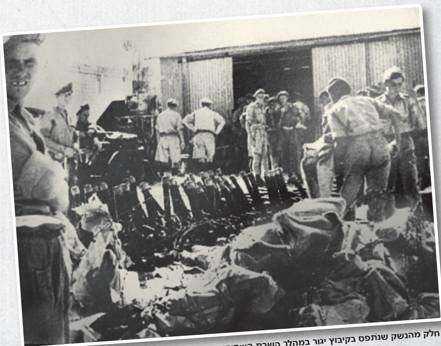
חלק מהנשק שנתפס בקיבוץ יגור במהלך השבת השחורה

חיפושים ומעצרים נערכו גם בקיבוצים רבים. במסגרת "השבת השחורה" נעצרו ברחבי הארץ כ-2,700 איש, שהועברו למחנה המעצר ברפיח. יומיים לאחר מכן התכנסה מפקדת ההגנה בראשותו של משה סנה, לדון בדרכים לתגובה. דעת המשתתפים הייתה שיש להמשיך במאבק המזוין וזאת כדי להוכיח לבריטים שלמרות המאסרים ההמוניים, לא הצליחו לשתק את תנועת המרי העברי.