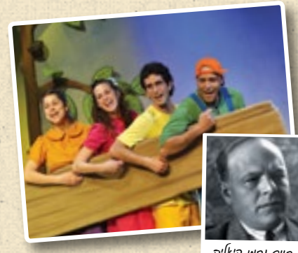
חיים נחמן ביאליק

הציפור שמתגוררת בגן של ביאליק הטילה ביצים בקן! הילדים מתרגשים ומנסים לדמיין איך ייראו הגוזלים. פינות הגן הקסומות שולחות אותם למסע צבעוני ומרגש של חברות, משחקים ושירים. מסע שבו הם נותנים חופש לדמיון וליצירתיות והופכים את הגן לממלכה הפרטית שלהם. בהצגה שזורים שירי הילדים הנצחיים של ביאליק: קן ציפור, נדנדה, פרש, הפרח לפרפר, מקהלת נוגנים, בגינת הירק, שתי בנות, עציץ פרחים ועוד.