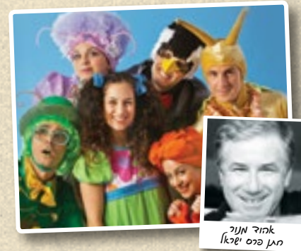
אהוד מנור מגן פרס ישראל

גלי היא ילדה אופטימית, מלאת דמיון ואוהבת טבע. לקראת עלייתה לכיתה א' היא מאד מתרגשת ומשתפת בתחושותיה את חבריה הטובים: דני השכן, הברוש, הנחליאלי ובעלי החיים בגינה. יחד איתם יוצאת גלי למסע קסום, חלקו בדמיונה, שבו היא מתמודדת עם המחשבות ועם הפרפרים שבבטן לקראת מה שצפוי לה במקום החדש, בבית הספר. במהלכו גלי לומדת מחבריה על המשמעות של חריצות ודבקות במטרה, על סבלנות ועל אמונה בעצמך.